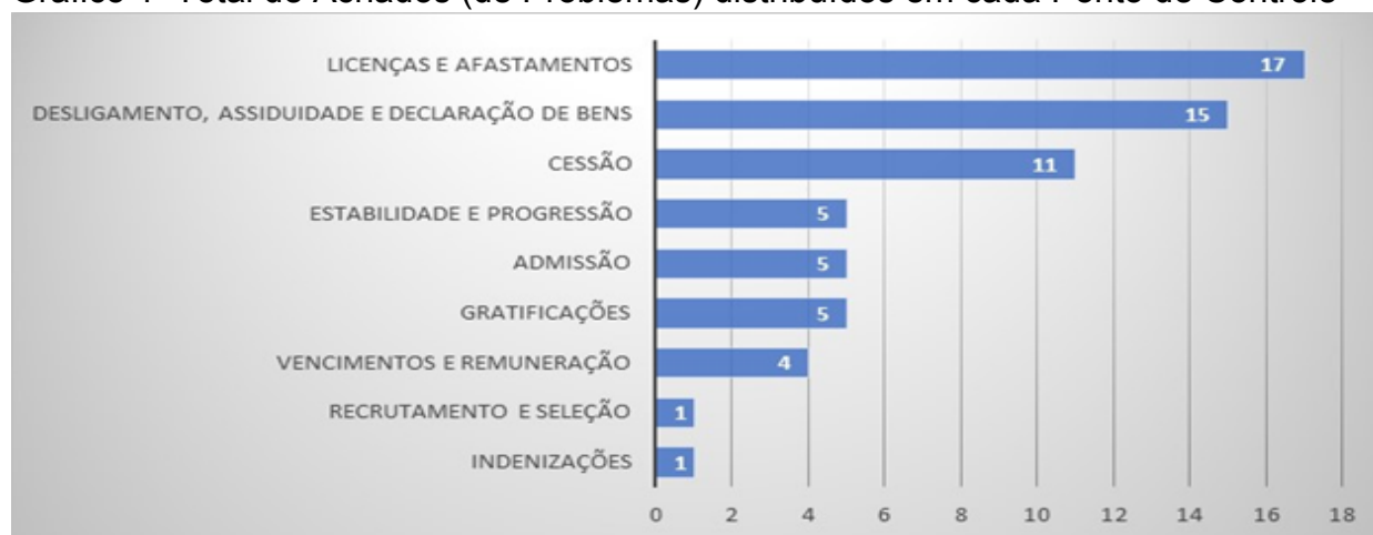
Gráfico 1 Total de Achados (de Problemas) distribuídos em cada Ponto de Controle